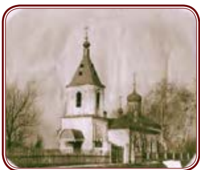
Храм в Былово 1960-е года XX в