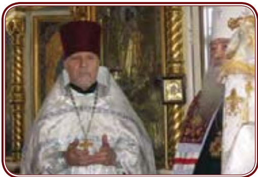
Митрополит Крутицкий и Коломенский Ювеналий ипрот. Василий Фесюк. Михаило-Архангельский храм. 2003 г.

Эти слова оказались весьма прозорливыми. Единственный в России Чудов монастырь в 1929 году стерт с лица земли. Но в новом веке, по молитвам Архангела Михаила и доброго Архипова сердца, его может ждать новая неожиданная, «нечаянная» слава: с созданием викариатства новых