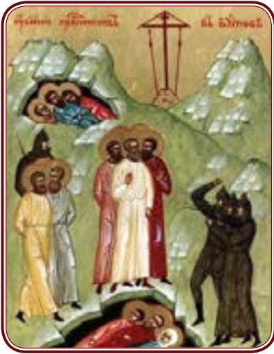
Убийство праведников в Бутове