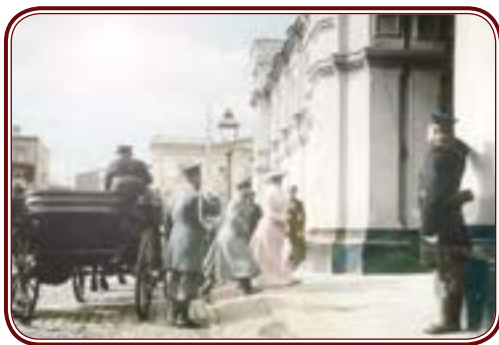
Николай II посещает Страстную монастырь.

Сегодня же в центре Москвы, у бывших Тверских ворот мы видим: стоит знаменитый кинотеатр «Россия», и спиной к нему — бронзовый Пушкин, склонивший голову перед входом в Макдональдс. Этот кинотеатр стоит на задворках бывшего Страстного монастыря, а памятник Пушкину — на месте его надвратной колокольни. В 1880 году он был установлен в конце Тверского бульвара. Пушкин стоял, склонив голову перед входом в Страстную монастырь, в котором он часто бывал при жизни. На специальных рельсах в 1950 году памятник перевезли на сегодняшнее место и развернули на сто восемьдесят градусов, а на пустыре к остаткам монастырского гостиничного корпуса в 1961 году пристроили кинотеатр «Россия» или «Пушкинский», как его называют сегодня... Кирпичная кладка четырехэтажной монастырской гостиницы переходит в бесформенный советский новодел, пристроенный к ней. А ведь когда-то каждый почетный гость Москвы, въезжая в Первопрестольную сквозь Тверские ворота, посещал и Страстную девичий монастырь, поклоняясь его святыням.