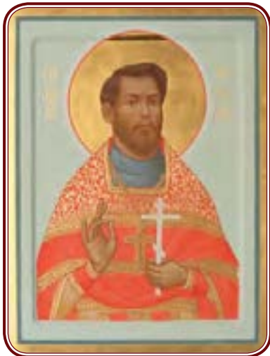
Икона священномученика Николая пресвитера Быловского

Отец Николай, как новый Архип, не дрогнул перед врагами