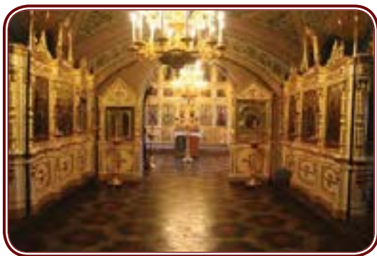
Михаило-Архангельский храм. внутренний вид.

московских территорий наш храм, чудесным образом, по молитвам Архангела Михаила и святого Архипа, становится первым на Москве храмом Чуда Архистратига Михаила, бывшего в Хонех - Да слышат люди глас Божий, как, исцелившаяся некогда, дочь элина! Да видят и воспоют люди свет Божий, как древле прозрела Царица Ордынская Тайдула по молитве святителя Алексея Московского!..