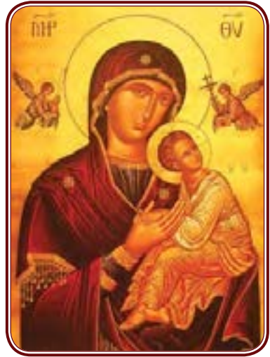
Страстная икона Божьей Матери