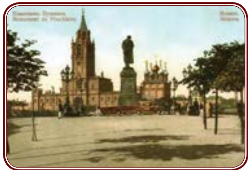
Страстной монастырь в Москве