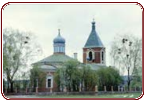
Храм в Былово 1970 года. XX в.

От Москвы до Воронова он был единственным действующим храмом в советские годы. «Трудно поверить, что это сельская церковь. Если бы мы ехали сюда с закрытыми глазами и открыли глаза только здесь, можно было бы подумать, что мы находимся в каком-