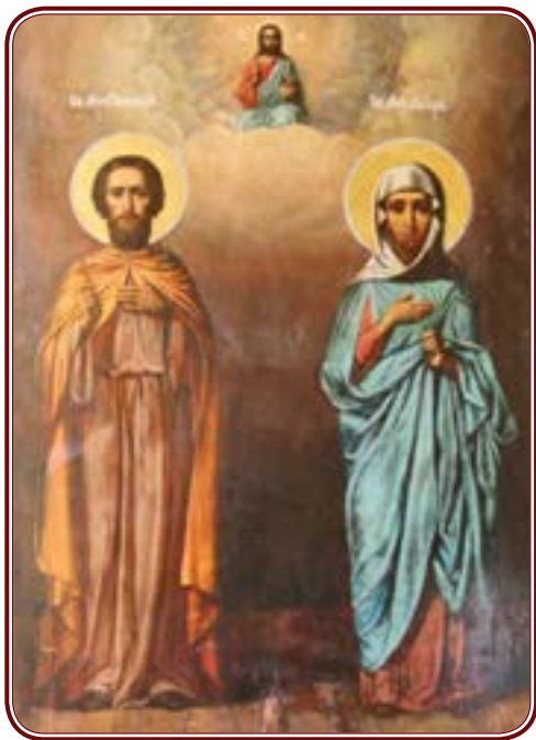
Святые мученики Тимофей и Мавра