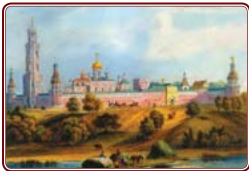
Симонов монастырь в Москве

В глубокой древности, когда апостолы Христовы еще ходили по земле с проповедью Евангелия, у одного элина, жившего в Малоазийском городе Колоссы, была дочь, немая от самого рождения. Однажды во сне этому греку явился ангел Господень и известил о том, что близ города Иераполя в местности, называемой Хепротопы, есть источник, в котором Господь силою своего Архангела Михаила исцеляет всех приходящих к нему и окунающихся в святой воде или омывающих в