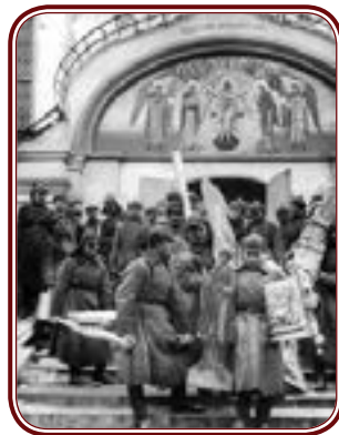
Разорение Симонова монастыря

Сегодня, на возвращенном Церкви островке монастырской земли, при Тихвинском храме, создалась община для слабослышащих и немых христиан. Вспомним эллина, у которого глухонемая дочь исцелилась в святом источнике в Хонех. Вспомним и о том, что храм в честь Чуда Архангела Михаила в Хонех вместе с селом Былово до секуляризации был Симоновой монастырской вотчиной.