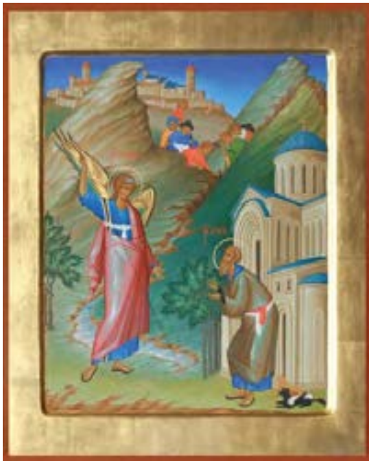
Икона чудо Архистратига Михаила в Хонех

исцелялись и исцелялись люди, страждущие от своих недугов - и разрушались, всегда разрушались неумолимые предприятия врагов Христовых, пытавшихся осквернить святое место. С годами вера его укреплялась, духовные подвиги возрастали, а молитва усиливалась. Возрастала и слава Михаило-Архангельского источника и храма, построенного здесь греком. Враги Христовы неотступно боролись со святыней — и вот, они